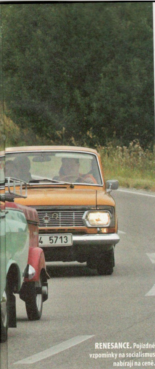
RENAISSANCE. Pojízdné vzpomínky na socialismus nabírají na ceně.