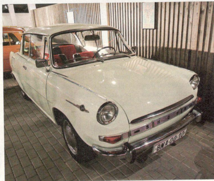
JEDE I TUZEX. Dříve se těmito auty pyšnila honorace. Brzy budou znovu dostupné jen pro movité lidi.